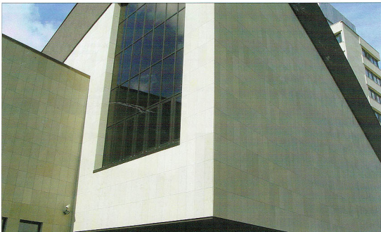
EREK OÜ poolt paigaldatud doloplaadist fassaad, EV Välisministeerium

EREK OÜ alustas paekivi töötlemist 15 aastat tagasi. Kasutatakse Orgita karjääri dolo- ja paekivi, samuti Kostivere muru päeplaati.